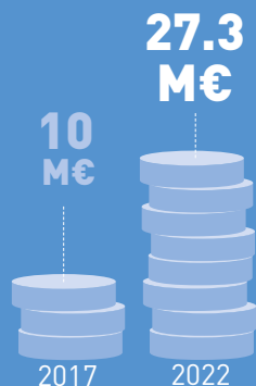
Sommes dépensées par les étudiants

1€ subventions de publiques = un impact global de 195.3€